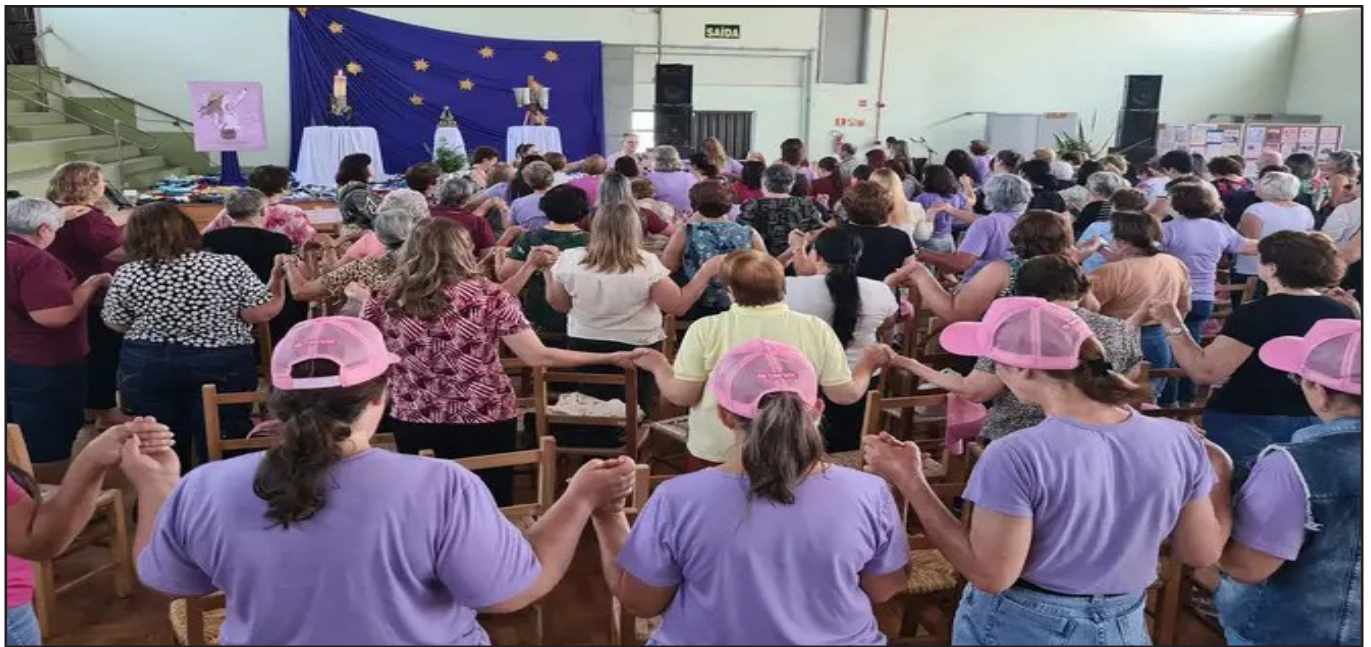
Dia Internacional da Mulher, Ipê - 08/03/2023

Ao longo do tempo muitas lutas e resistências vem acontecendo na Diocese de Vacaria. O Movimento dos Trabalhadores Rurais Sem Terra há 36 anos fazem história na Diocese de Vacaria; 2 anos de acampamento e 34 anos de assentamento, são 8 assentamentos com 349 famílias. Os assentamentos se mantem organizados e articulados na produção como agricultura familiar em parte com produção orgânica. Muito nos alegamos ao ver essas famílias vivendo de forma digna e justa colhendo os frutos do seu trabalho e de suas lutas, como diz o Papa Francisco “a ecologia humana é inseparável da noção de bem comum, principio esse que cumpre um papel central e unificador na ética social é o conjunto das condições da vida social que permite, tanto aos grupos como a cada