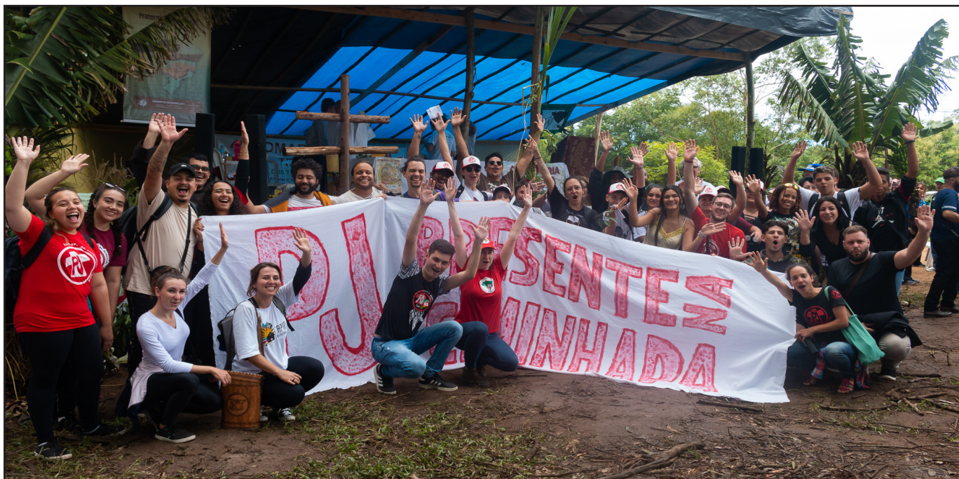
Foto: 45ª Romaria da Terra, 21/02/2023

As sementes crioulas são uma herança ancestral das comunidades rurais, as quais passam de geração em geração, em forma de saberes, tradição familiar, agricultura e alimento. Essa tradição, se mantém viva em muitos municípios do Estado do RS e nas mais diferentes comunidades. São produzidas diferentes cultivares de alimentos anualmente, multiplicadas e entregues a guardiões que serão os protetores, os quais tem por incumbência proteger essas sementes para a safra seguinte.