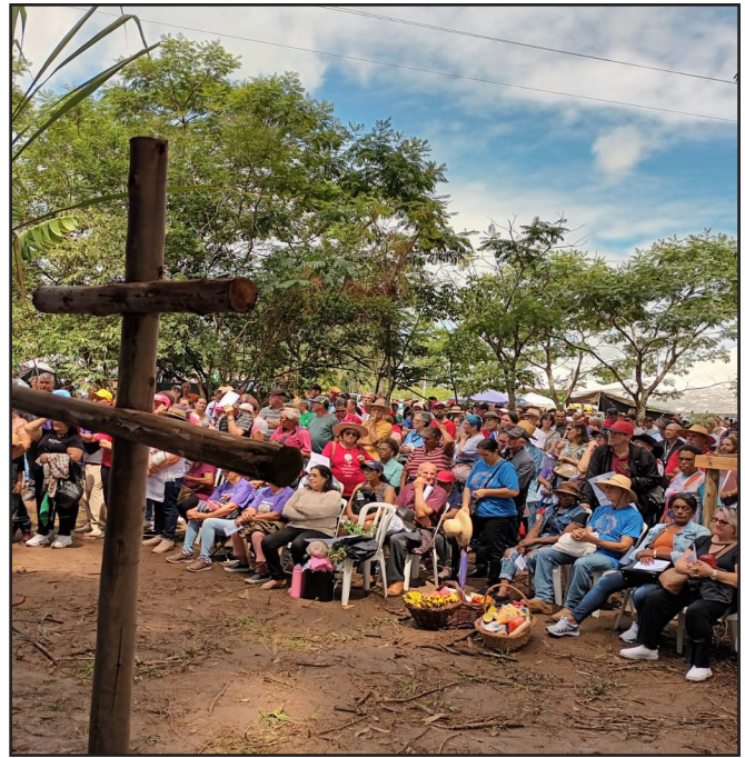
45ª Romaria da Terra, 21/02/2023

que sofrem, o que produzem, como fazer para enfrentar o opressor. Não é possível “calar” quando alguém quer expressar a sua dor, o seu clamor, o seu sofrimento.