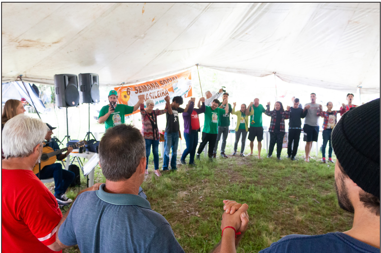
45ª Romaria da Terra, 21/02/2023

- Juventude Camponesa – Existe várias iniciativas de formação de educação no campo com foco no cooperativismo e na agroecologia, com escolas voltadas a esta formação visando o protagonismo juvenil. Com destaque a Escola de Jovens Rurais-EJR na Diocese de Santa Cruz do Sul que há mais de 30 anos prioriza a juventude da roça com um curso de formação de lideranças onde se aborda o Associativismo e Cooperativismo, a Agroecologia e a Organização Social e Política, e claro o eixo Pastoral. Experiência que tem formado muitos agricultores e agricultoras ecologistas, além de lideranças pastorais e ser a chamada “sementeira de lideranças da CPT”.