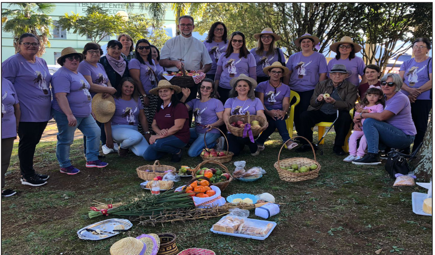
Foto: Celica Webber, coletivo mulheres agricultura familiar, Ipê - abril/2023

Queremos destacar, de modo especial, a presença de Maria em nossas lutas e devoções. Maria, a mãe que cuidou de Jesus, agora cuida com carinho e preocupação maternal deste mundo ferido. Maria não só conserva no seu coração toda a vida de Jesus, que “guardava” cuidadosamente (cf. Lc 2,51), mas agora compreende também o sentido de todas as coisas. Por isso, podemos pedir-lhe que nos ajude a contemplar este mundo com um olhar mais sábio. (Laudato Si, VI, 8 /241).