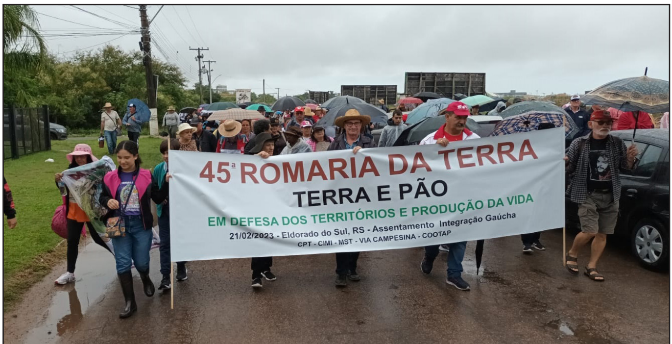
Foto: 45ª Romaria da Terra, 21/02/2023

De tudo o que dissemos acima, devemos passar à prática, ao agir. Uma forma de fazê-lo é preparar e participar da 46ª Romaria da Terra. Mas isto não basta! É preciso conhecer e tornar-se “agente” de novas práticas e de novas formas de conduta diante do mundo em que vivemos. Não podemos concordar e fazer aquilo que diminui o ser humano e a nós. É necessária uma atitude de conversão na direção do CUIDADO DA CASA COMUM, da relação com o MÃE E IRMÃ TERRA. Eis o nosso desafio! Entrando desde agora no rumo da Romaria da Terra...