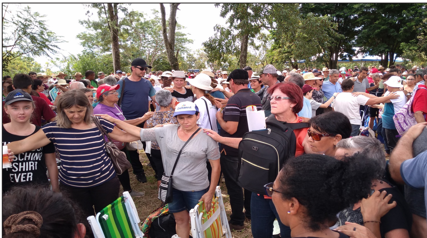
Foto: 42ª Romaria da Terra, 05/03/2019